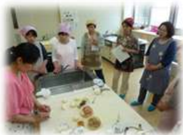
手でこねるパン教室