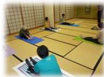
セルフリンパマッサージ