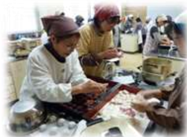
和菓子づくり教室