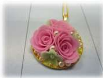
クレイフラワー教室(体験講座時の様子)