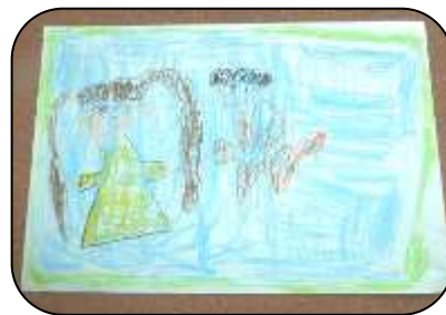
いまたき せおんさん 「プール楽しみ〜!」