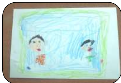
こぎそ たいがさん 「プール掃除頑張った!」