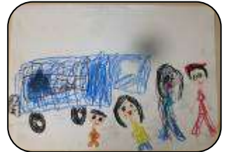
えほんバスがきたよ！ はしば ゆいか