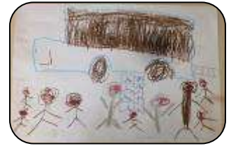
たのしいえほんみ〜つけた！ ないとう そうた