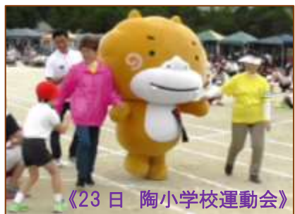
《23日 陶小学校運動会》