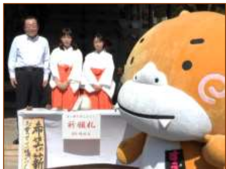
《24日 陶与左衛門窯まつり》 六連房の登り窯、たくさんの作品が焼きあがるよ。今年は晴天でよかったね。

その他、8月26日どんぐり工房夏祭り、9月2日中仙道チャリティー夏祭り、9月3日東濃ぐるりん観光イベント、9月24日みずなみ陶器まつりにも参加したよ。