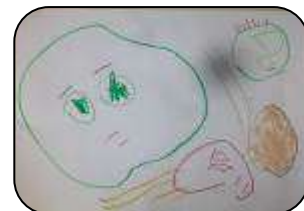
こまいぬまつりにいったよ！ みずの こうだい