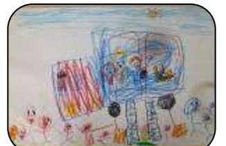
えほんがいっぱい！ あさい みさき