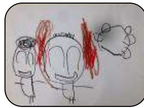
たいこ、さいこ〜！ ひろせ はると