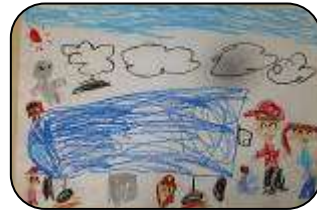
どれにしようかなあ！ ほった さわ