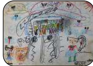
えほんだいすき！ ながい りの