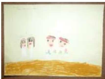
たかやま いなさん 「ドキドキ発表会！」