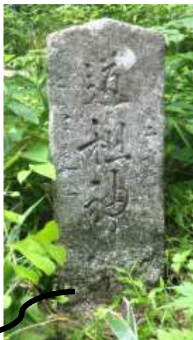
①吹越峠吉良見側 (中馬街道)