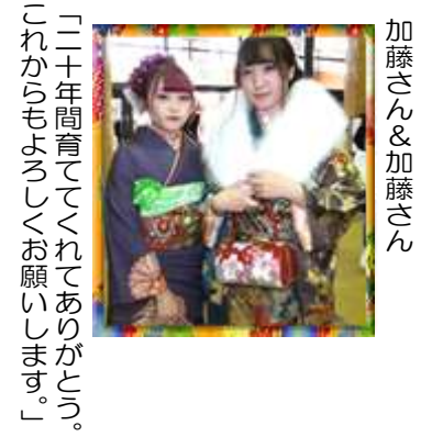
加藤さん & 加藤さん