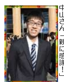
中山さん「親に感謝!」