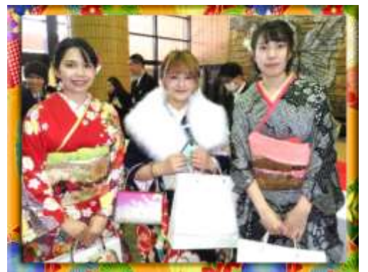
グループ写真 -女子編-