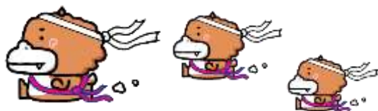
第56回陶一周駅伝競走大会 コース・区間別距離