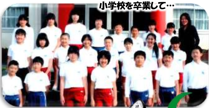
小学校を卒業して...