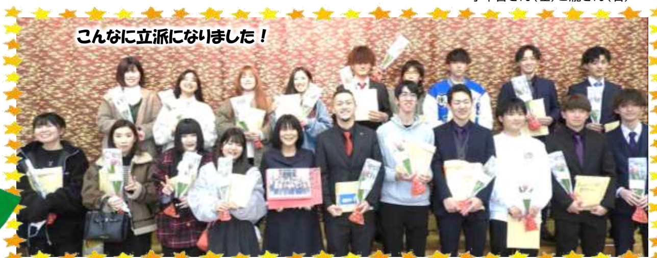
こんなに立派になりました！