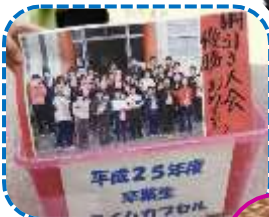
小6に詰めたタイムカプセルオープン！ その中身は！?