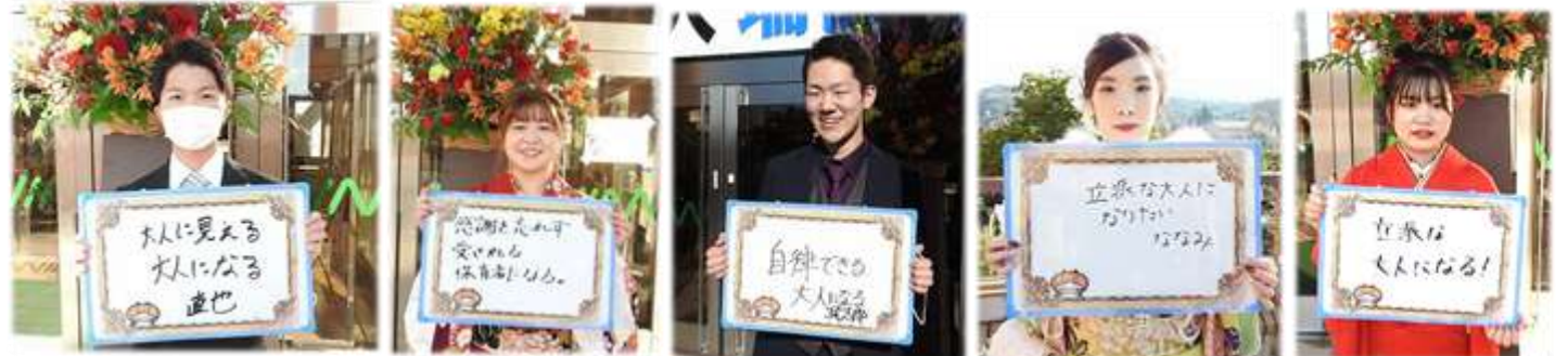
写真撮影に協力してくれた新成人の皆さん、またその保護者の皆さん、ご協力ありがとうございました。