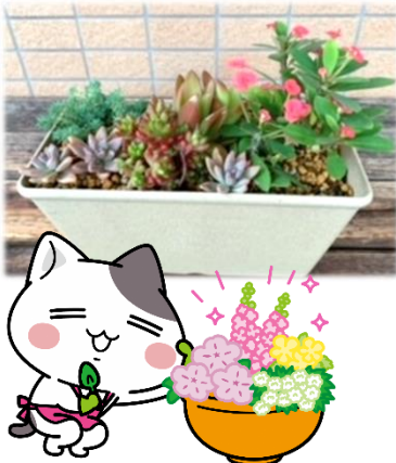
《多肉植物の寄せ植え》