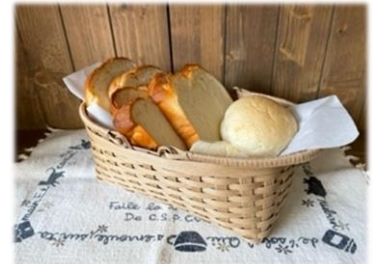
《クラフトバンドでかご作り》