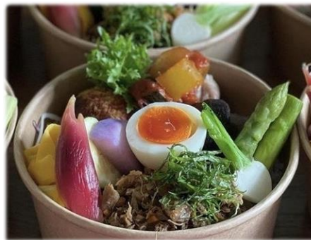
春らしく美味しいお弁当を作ってでかけませんか？