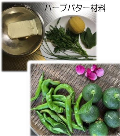
ハーブバター材料