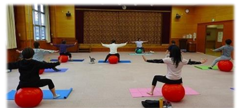
受講者は年齢関係なく、ご自身のペースと体調にあわせてレッスンを受けます。一時間の講座では、無理のない運動ができます。