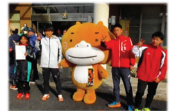
新年マラソン大会(1月)

岐阜市内でのイベントでは、すえっこくんのパンフレットを配布して瑞浪市や陶町の魅力をPRしました。