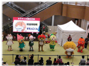
カラタン誕生日会(11月)

岐阜市内でのイベントでは、すえっこくんのパンフレットを配布して瑞浪市や陶町の魅力をPRしました。