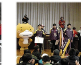
陶一周駅伝競走大会(2月)