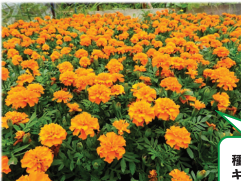
種から育てた夏花 キレイに花が咲きました