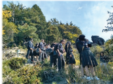
うさぎ岩の見学にも向かいました→

実際に見て、地元の方と対話することで地域のニーズをとらえ、課題を見出していけるよう考えていきました。