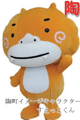
陶町イメージキャラクター すえっこくん

《編集・発行》陶町明日に向かって街づくり推進協議会 事務局 陶公民館 〒509-6361 瑞浪市陶町猿爪 405 番地の1