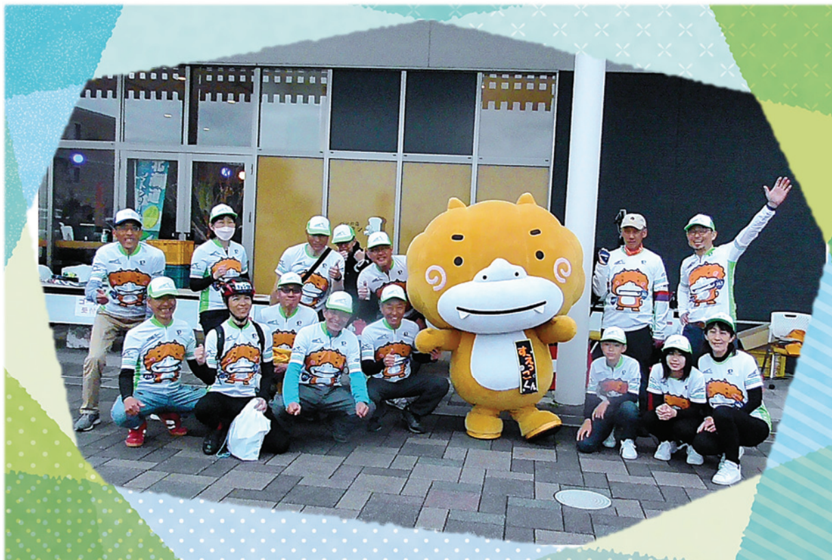
《グランfond東濃 2023 にて》

もちろん、陶町内のお祭りや行事にも参加して、踊ったり、みんなと一緒にゲームを楽しむなど、会場を盛り上げました。