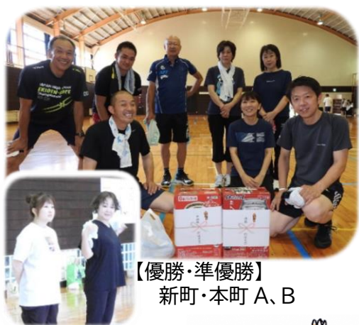
【優勝・準優勝】 新町・本町 A、B