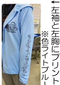
←左袖と左胸にプリント ※色ライトブルー