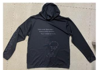
バックプリント↑※色ブラック

ドライジップパーカーが新発売！メッシュ素材で吸汗素材。前開きファスナー。日中は暑いけど、朝夕は少し肌寒い今にピッタリ。陶コミュニティーセンターにて販売しています。 ◎色：ブラック、ライトブルー ◎サイズ：M~LL(※メンズサイズ) ◎価格：3,500円(税込み) ☆陶コミにて実物をご覧ください