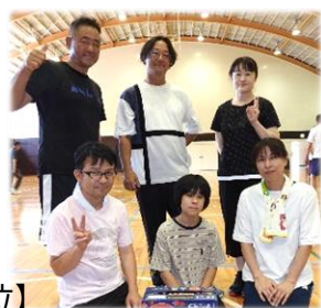
【3位】 梨ヶ根・元町・下山