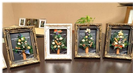
↑クリスマスオブジェ